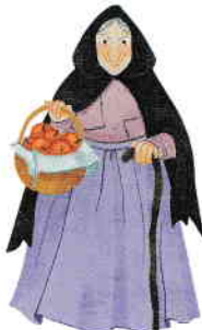
Mama vitregă bătrână